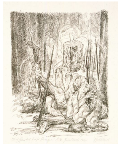
Blatt 4 In der Wolfsgrube Aufgespießte

Abgesehen von dem nun durch LETTER Stiftung erworbenen ist derzeit nur ein weiteres Exemplar der in einer Auflage von 25 Exemplaren geplanten Folge bekannt. Dieser Abzug Nr. 1 aus dem Besitz des Kunstsammlers Heinrich Stinnes befindet sich heute in der „Sammlung Weltkrieg“ der Universitäts- und Landesbibliothek Münster. Allerdings fehlt dort die Titellithographie auf grauem Tonpapier, womöglich ein Fragment der ursprünglichen Mappe. Stinnes hatte die Folge laut Angaben auf seiner Mappe 1917 bei