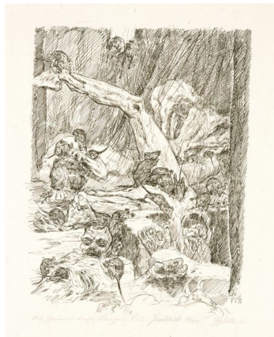
Blatt 2 Verschüttete und Erschlagene