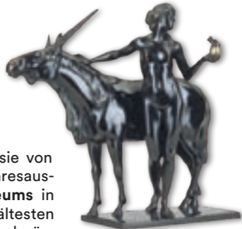
Rudolf Henn Märchen vor Juni 1907 • Bronze

In diesem Jahr 2026 richtet sie von April bis November die Jahresausstellung des Krahuletz-Museums in Eggenburg aus – eines der ältesten und vielseitigsten Museen Niederösterreichs. Unter dem Titel Märchen, Mythen & Legenden Jugendstil zu Gast im Krahuletz nehmen inmitten der Dauerausstellung von Mineralien und Fossilien, der Erd- und Menschheitsgeschichte, von Gläsern, Uhren und der Archäologie allerlei Kleinbronzen Platz: Schatzgräber und Meerjungfrauen, Kobolde, Drachen und Elfen, Froschkönige und das ganze bukolische Gefolge um den Weingott Bacchus. Märchen-Graphik und Gemälde ergänzen die Präsentation und das reiche Rahmenprogramm – näheres findet sich unter www.krahuletzmuseum.at