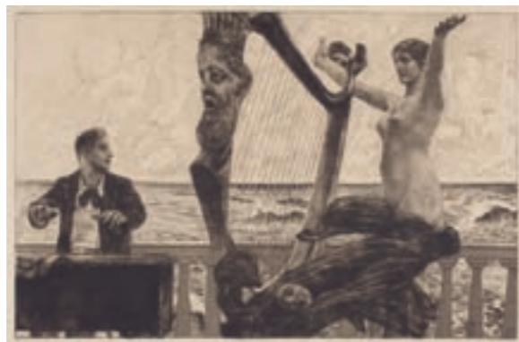
Max Klinger (64) Evocation (Brahmsphantasie) , 19) 1890/1894

Damit geriet (in Max Klingers Bildwerk: (19) Die Neue ) Salome im Symbolismus um 1900 zum mannseits definierten und gefürchteten pars pro toto ihres Geschlechts als einer männermordenden Spezies. (32) So wie Odysseus sich auf seiner Meeresfahrt (allerdings freiwillig, weil begierig zu lauschen) dem betörenden Gesang der Sirenen aussetzte, sucht das männliche Auge unentwegt das (ihm) ideale Schöne, findet es in (18)+ (30) Aphrodite respektive Venus, und in der sprichwörtlich so schönen (33)+ (34) Helena , der durch Paris, den narzißtischen Schönling, erst Ver- und dann Entführten. Anziehung, atavistische Furcht und Zurückweisung zugleich kommen in diesem steten Wechsel männlich emotionaler Disposition wohl nie zur Ruhe.