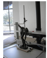
Vermessung von Bildwerken

um somit auch verschiedene Exemplare etwa einer Druckgraphik untereinander ordnen sowie Zustände