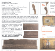
Erfassung von Bildw

Hierzu stehen wir anderen Sammlungen auf Wunsch beratend zur Seite, haben eine Vermessungseinrichtung entwickelt sowie eine kleine Handreichung, die Beispiele der erfassungsrelevanten Aspekte von Bildwerken vermittelt.